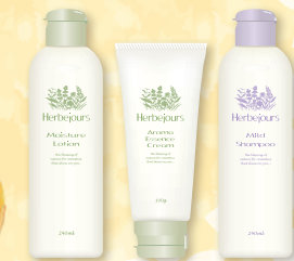
モイश्チャー ローション アロマ エッセンス クリーム マイルド シャンプー