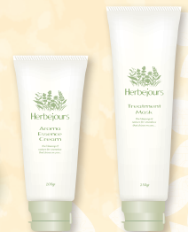
アロマ エッセンス クリーム トリートメント マスク