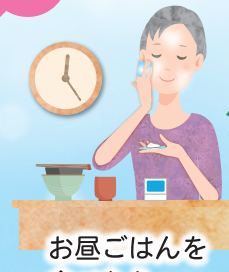
お昼ごはんを 食べた後