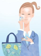
職場の休憩時や 外出先で